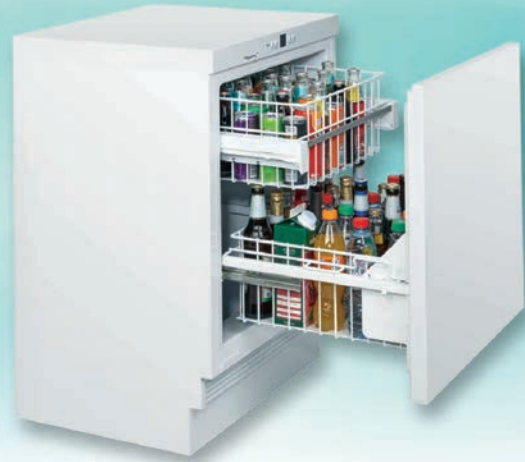
Abbildungen ohne vormontierte Befestigungsschiene